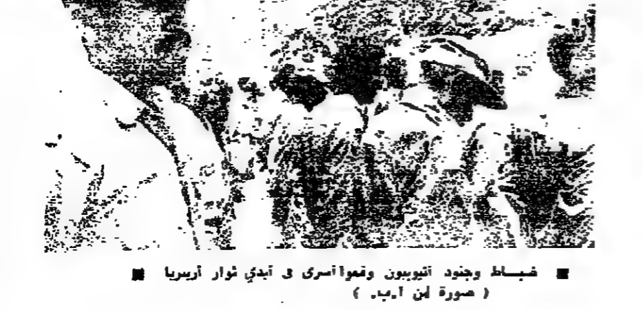
شباط وجنود اثيوبيون ومعا أسرى في أيدي ثوار اثيوبيا

من أمين الى رينيه كان الرئيس عيدي أمين اول من هنا رئيس سيشل الجديد البر رينه يرقية قال فيها: « يعني ان اؤكد لك بان المسؤولين الثوريين في اثيوبيا مستعدون لمساعدتك في كل وقت اذا تعرضت حكومتك لاي خطر، ونحن مستعدون لتقديم مساعدتك خلال ساعات معدومة ». واتي أمين بريقته محظرا: « على سيشل ان تظهروا حزما، لان البريطانيين سيحاولون نسف حكومتكم ثم لا يبدون الحكم الاثيوبيا بطني ».